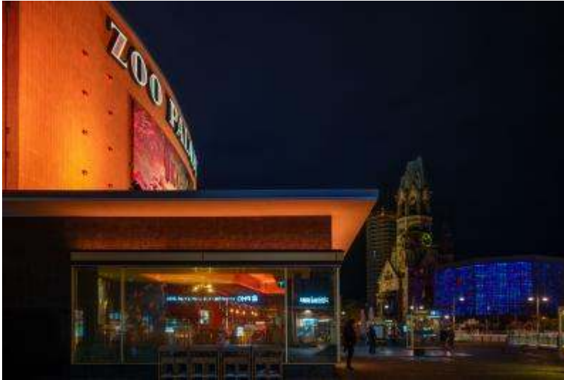
Breitscheidplatz in Berlin

Die Zeit der Pandemie hat uns gelehrt, die kleinen Dinge in unserer Umgebung mehr zu schätzen. Vor etwa drei Jahren fing ich an, durch den Sucher meiner Kamera zu schauen, mit einem Makro-Objektiv, und entdeckte eine Welt, die so viel mehr war als nur ein dunkler Fleck auf einer Blüte. Es war mehr als „nur ein Viech, das vielleicht auch noch sticht“.