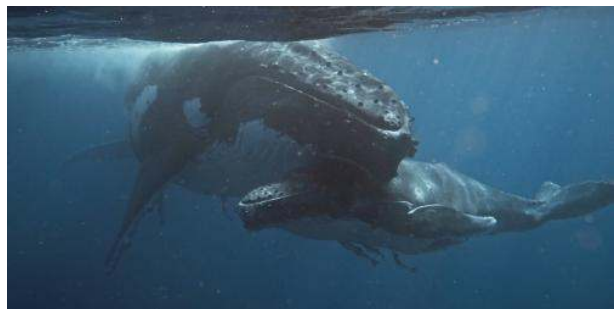
Buckelwalkuh und ihr Kalb kuscheln