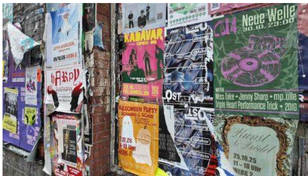
Stadtbild: Event-Expressionismus (Kollektion Herbst/Winter 2025)

Während ich gemütlich sitze und auf meine Köfte in Tomatensauce warte (10 bis 15 Minuten für ein Ofengericht gehen voll OK), überlege ich, was eigentlich eine hübsche Straße ausmacht. Das Thema wird mir zu kompliziert, darum entscheide ich mich, die Experten für Stadtbilder zu fragen. Ohne das nomen delicti zu nennen, möchte ich von der CDU-Fraktion Leipzig per E-Mail wissen, wie sie denn die Situation auf der Eisi nach Ende der Waffenverbotszone einschätzt. Man antwortet mir: Für eine Aussage sei es noch zu früh. Außerdem nennt man mir die offiziellen Kriminalstatistiken als Quelle. Ist das neu? Seit wann braucht die CDU für einen Kommentar eine sorgfältige Analyse? Ich denke an diese Statistik und befürchte Rechercheaufwand. Wenigstens lassen mich die Köfte nicht im Stich, ich esse, zahle und gehe.