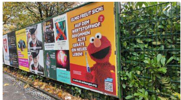
Stadt bild : Elmo fordert bewusste E-Schrott-Entsorgung