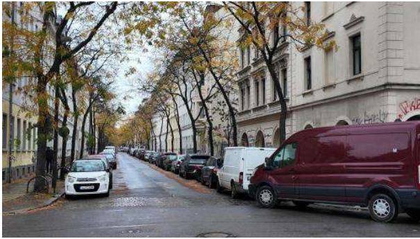
Stadtbild: Gleich viel sauberer