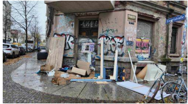
Stadtbild: OK, doch nicht

Ich hatte auch der AfD Leipzig geschrieben, aber bei denen hat man den Braten wohl gerochen. Und wenn die Experten für Rassismus nicht antworten, bleibt ein schrecklicher Verdacht: Kann es sein, dass es für manche politisch opportun ist, dass den migrationsstarken Stadtbezirken der Ruf besonderer Gefährlichkeit anhaftet? @Stadtrat: Ein paar entrümpelte Möbel vor den Häusern machen noch lang kein Ghetto. Und wenn's nach den Zahlen geht, stimmt auf den besseren Straßen Leipzigs das Stadtbild nicht.