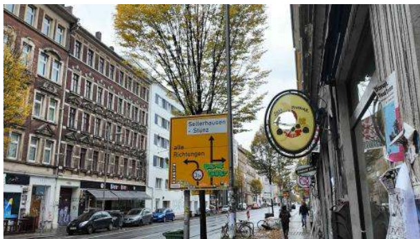
Stadtbild: Ramponierte „Bier“-Werbung vor veganem Restaurant

Wer die Hoffnung für sein Leben völlig aufgegeben hat, der findet sich fast am Ende der Eisenbahnstraße irgendwo zwischen den Hausnummern 116 und 136 ein. Passend zur Gentrifizierung steht dort eines der beliebtesten veganen Restaurants in Leipzig, in der Nr. 128, mit 4,7-Sternen auf Google. Man sitzt dort auf Möbeln, die irgendwas mit Kunst zu tun haben. Und zum Vönerteller oder zur „Seitanwurst in pikanter Currysauce“ wird ausschließlich tschechisches Bier gereicht. Ginge es nach Markus Söder, dann ist man hier, an diesem Ort, im neunten Kreis der Hölle angekommen. Fleischloses Essen, in Imbissqualität zu Restaurantpreisen, und dazu Bier mit unbekanntem Reinheitsgebot. Zum Glück halten mich die Köfte weiter gesättigt, denn mir reicht's.