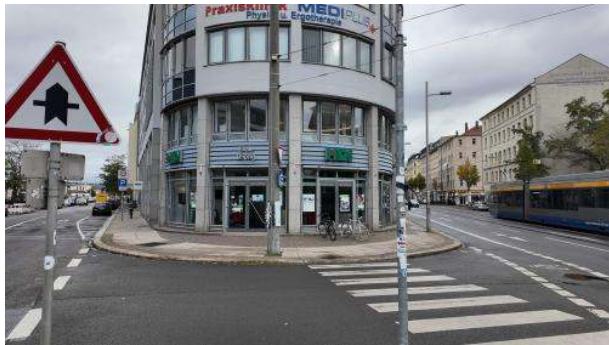
Stadt bild : Leerer Pfosten, hier stand mal das Waffenverbot

Jetzt sorgen an der Ecke Hermann-Liebmann-/ Eisenbahnstraße in einem schmucklos hergerichteten Gebäude drei Beamte für Recht und Ordnung. Und zwar tagesabhängig entweder von 14 bis 17 oder von 9 bis 12 Uhr, freitags geschlossen. Wer polizeiliche Hilfe benötigt, der beachte bitte die Öffnungszeiten.