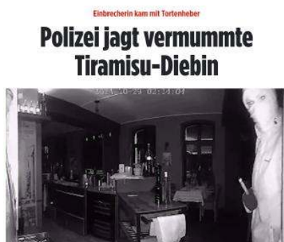
Stadtbild: BILD covert die wahren Verbrechen

Ich denke an das Gemüse. Ist es das, was diese Stadt ausmacht? Oder doch das Tiramisu? In der Könnerritzstraße, im Westen Leipzigs, brach eine 31-Jährige im September und Oktober 2024 gleich zweimal beim selben Italiener ein – nicht wegen Geld, sondern wegen des Tiramisu. Während die Überwachungskamera alles filmte, verpackte sie das Zeug mit Tortenheber und Alu-Assietten und ging wieder. Zwei Monate später schlug (nachdem man vorher ernsthaft DNA-Proben entnommen hatte) die SOKO Tiramisu am Flughafen zu, wo die Dame nach Ägypten abhauen wollte. Seither sitzt sie in U-Haft, es drohen ihr einige Jahre Gefängnis. An sich möchte ich der Obrigkeit ja keinen Rassismus unterstellen. Sind es also die Kopftücher, die Merz mit „Stadtbild“ meint? Oder die Tiramisu-Delikte? Oder ist es dieses unsägliche Gemüse? Mit offenen Fragen zieh ich weiter.