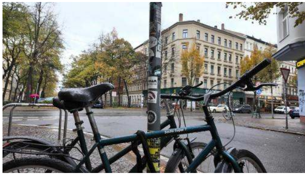
Stadtbild: CO 2 -bewusste Mobilität