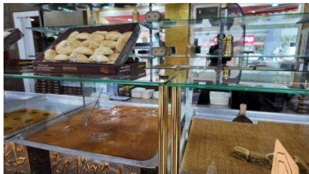
Stadtbild: Nach Vöner-Verzehr kann man Trost im Baklava finden