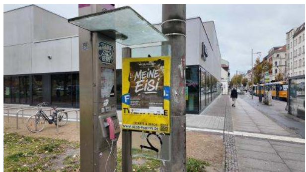
Stadtbild: Das neue Sportbad am Rabet, im August eröffnet, 3,8 Sterne auf Google