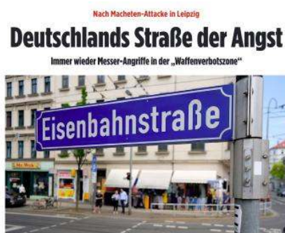
Stadt bild : BILD macht im Mai 2024 guten Journalismus

Bei mir, Frust: Da zieht man von dieser Straße weg und in nur wenigen Monaten wird die Waffenverbotszone aufgelöst? Das Warnschild an der Ecke Rosa-Luxemburg-/ Eisenbahnstraße: abgebaut. Also nur eine Straße unter vielen? Das Victorinox in meiner Hosentasche fühlt sich sinnlos an, denn wenn's erlaubt ist, wo liegt der Reiz? Ich überlege, was Friedrich und viele andere Deutsche am Stadtbild stört. Ist das Problem, dass die BILD-Zeitung nicht mehr zuverlässig berichtet, wo's gefährlich ist und wo nicht? Und man gezwungen ist, selbst Erfahrungen zu machen?