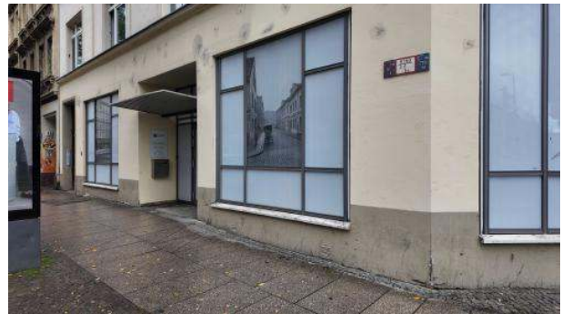
Stadt bild : Im Sächsischen Brutalminimalismus gehaltene Polizeidienststelle

Bei mir, Frust: Da zieht man von dieser Straße weg und in nur wenigen Monaten wird die Waffenverbotszone aufgelöst? Das Warnschild an der Ecke Rosa-Luxemburg-/ Eisenbahnstraße: abgebaut. Also nur eine Straße unter vielen? Das Victorinox in meiner Hosentasche fühlt sich sinnlos an, denn wenn's erlaubt ist, wo liegt der Reiz? Ich überlege, was Friedrich und viele andere Deutsche am Stadtbild stört. Ist das Problem, dass die BILD-Zeitung nicht mehr zuverlässig berichtet, wo's gefährlich ist und wo nicht? Und man gezwungen ist, selbst Erfahrungen zu machen?