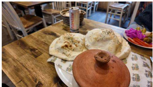
Stadtbild: Köfte und Ofenbrot