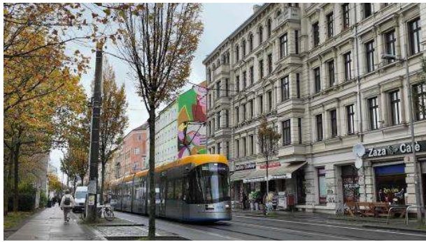
Stadtbild: Keine Dealer