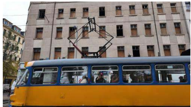
Stadtbild: Sozialistische Gedächtnisbahn