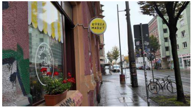
Stadtbild: Exotische Genüsse

Ich denke an das Gemüse. Ist es das, was diese Stadt ausmacht? Oder doch das Tiramisu? In der Könnerritzstraße, im Westen Leipzigs, brach eine 31-Jährige im September und Oktober 2024 gleich zweimal beim selben Italiener ein – nicht wegen Geld, sondern wegen des Tiramisu. Während die Überwachungskamera alles filmte, verpackte sie das Zeug mit Tortenheber und Alu-Assietten und ging wieder. Zwei Monate später schlug (nachdem man vorher ernsthaft DNA-Proben entnommen hatte) die SOKO Tiramisu am Flughafen zu, wo die Dame nach Ägypten abhauen wollte. Seither sitzt sie in U-Haft, es drohen ihr einige Jahre Gefängnis. An sich möchte ich der Obrigkeit ja keinen Rassismus unterstellen. Sind es also die Kopftücher, die Merz mit „Stadtbild“ meint? Oder die Tiramisu-Delikte? Oder ist es dieses unsägliche Gemüse? Mit offenen Fragen zieh ich weiter.